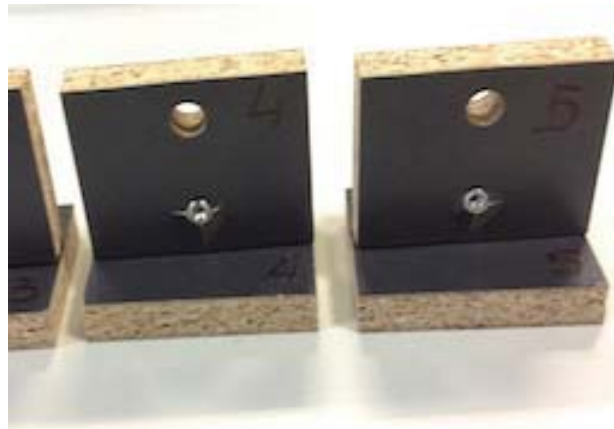
- Specimens at the end of the test -

This test report is part of a PDF file digitally signed by Franco Bulian on 10/02/21.