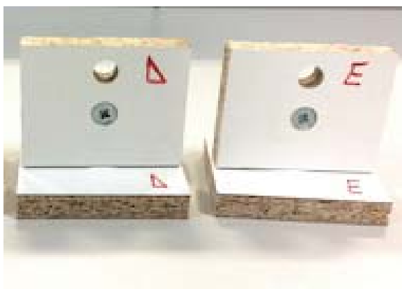
- Specimens at the end of the test -

This test report is part of a PDF file digitally signed by Franco Bulian on 10/02/21.